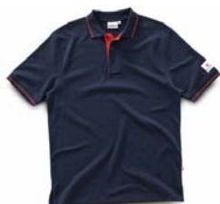
Poloshirt mit Name und Startnummer