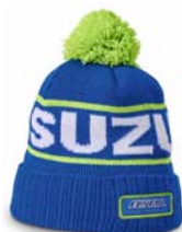
Haube mit Startnummer