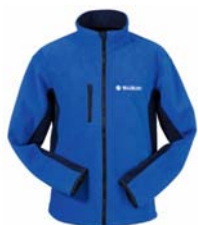
Fleecejacke mit Name und Startnummer

Das SUZUKI Challenge Paket beinhaltet voraussichtlich folgende Artikel: (Änderungen noch vorbehalten.)