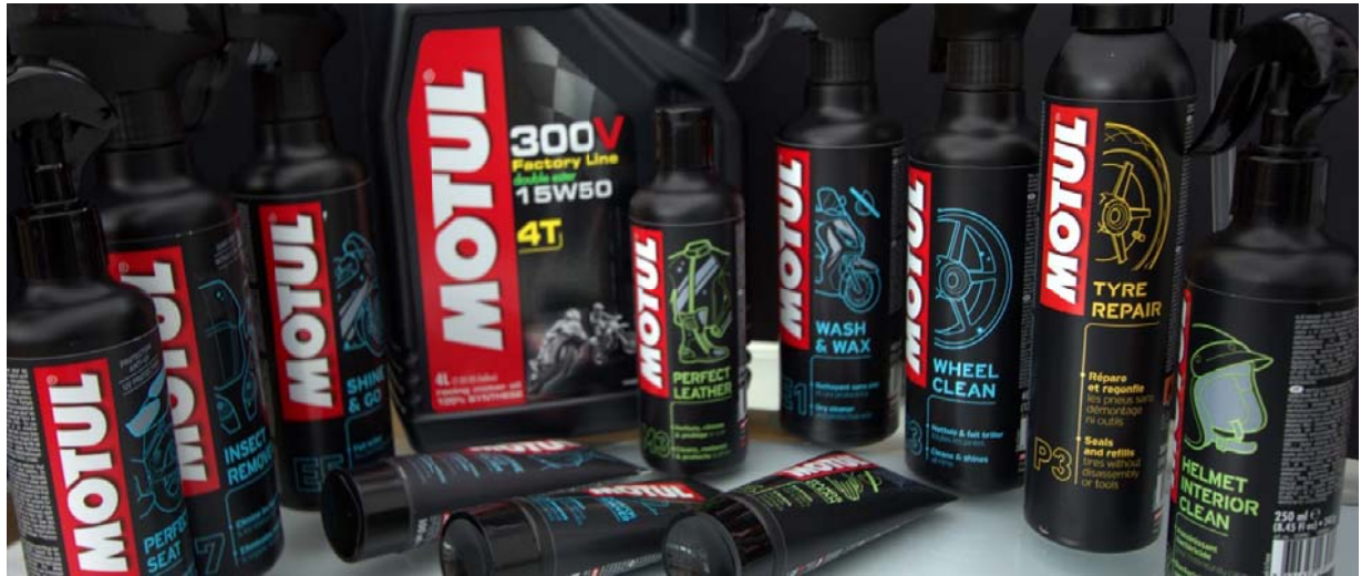
1x Motul Pflege und Merchandisingpaket im Wert von € 100,-